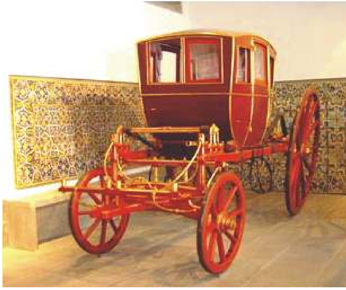
Traquitana – Sec XVIII e XIX