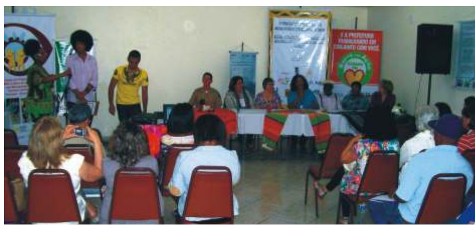
Mesa redonda de Museus Comunitários e Ecomuseus