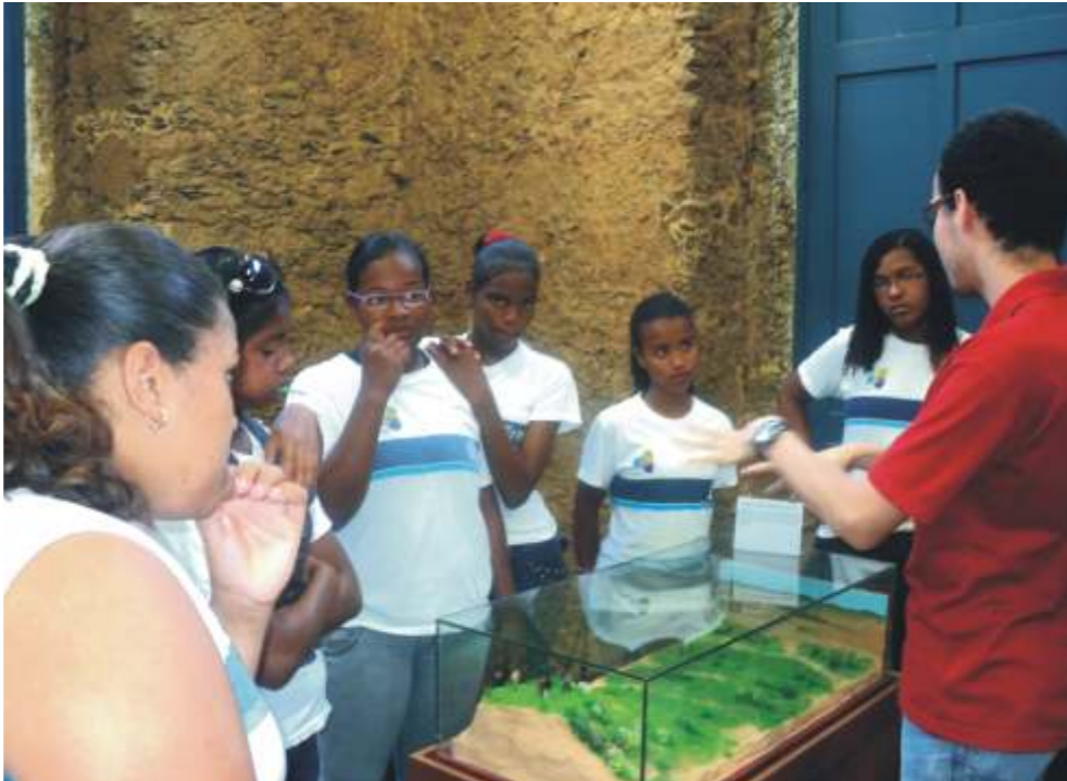
Estudantes da Rede Pública em visita mediada pelo NOPH observam a mesma cena em forma de maquete de Janaina Botelho.

É o ponto mais alto de Santa Cruz (cerca de 65m). Dalí os jesuítas observavam as terras em sua volta e podiam tomar conhecimento do que ocorria. Era chamado “Atalaia dos jesuítas” (sentinela). Na era monárquica ali foi erigida uma pequena construção, em formato octogonal, para que os observadores ficassem melhor acomodados. A realeza, membros da Corte, artistas das missões estrangeiras (francesa, austríaca, entre outras), personagens fa-