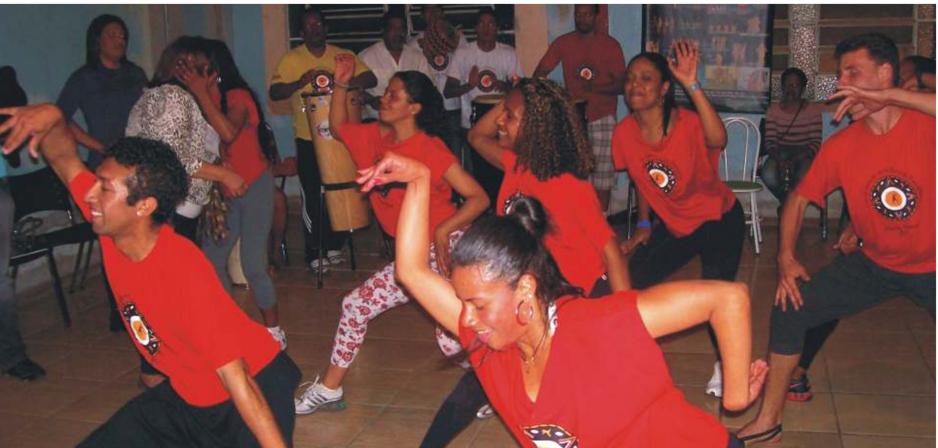
Apresentação da Oficina de Dança e Matriz Africana