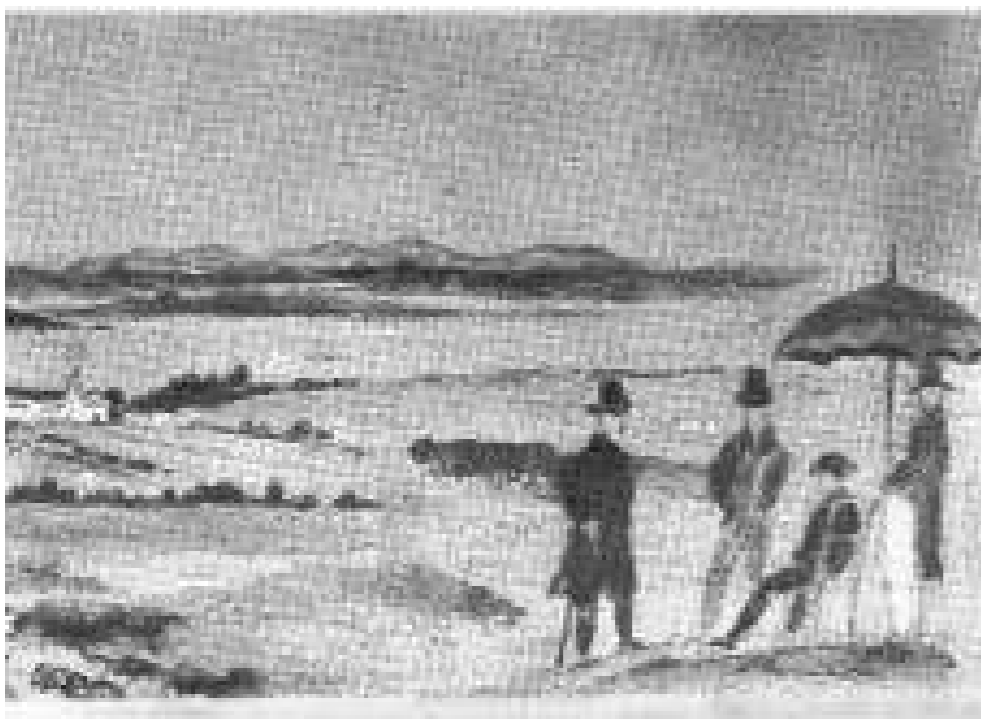
D. Pedro II, ainda menor, no alto do Morro do Mirante observa a Fazenda de Santa Cruz ao fundo, quadro de Benjamim Mary