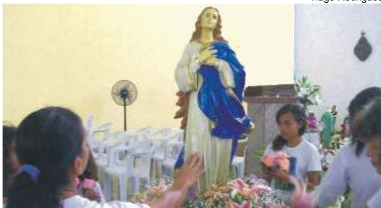
Fiéis veneram a Imaculada Conceição, após a procissão.

A imagem de N.Sra. da Conceição se destacava no altar todo florido, - a maioria das vezes usavam lírios, também