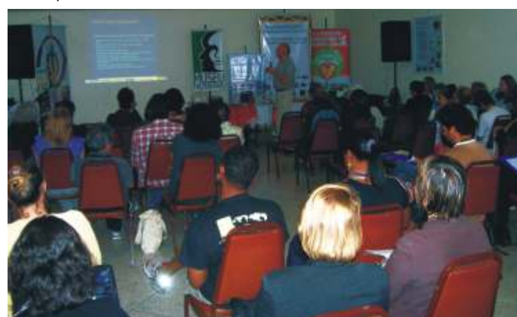
Hugues de Varine faz conferência do dia 31 de outubro