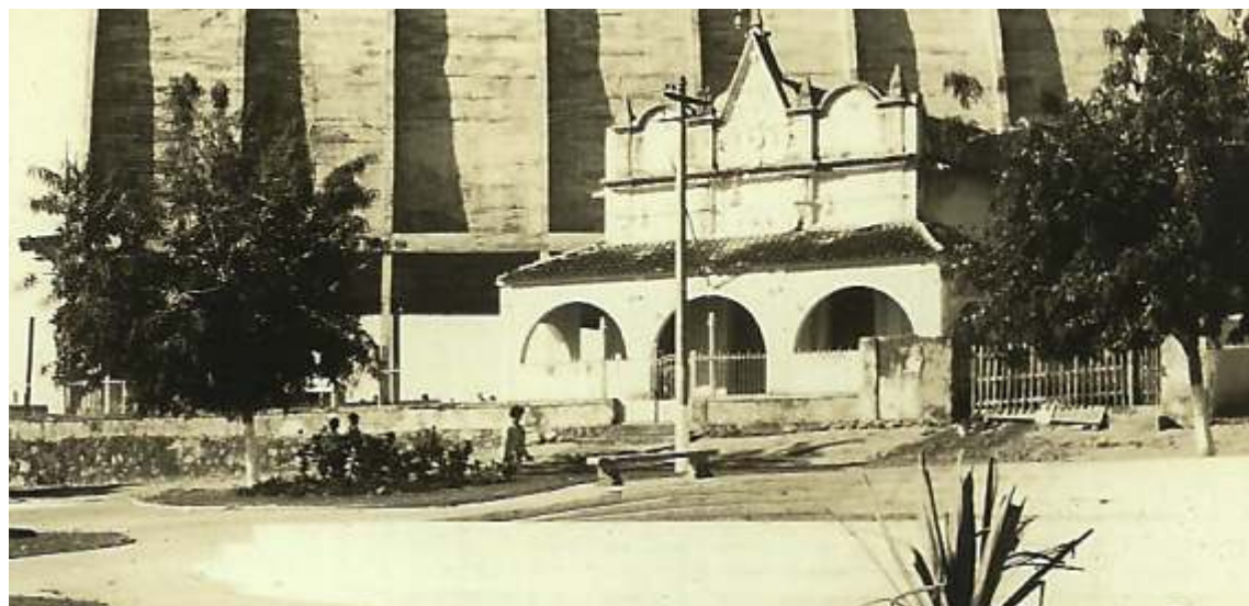
Antiga sede da Sociedade Musical Francisco Braga na Praça Dom Romualdo, hoje totalmente modificada