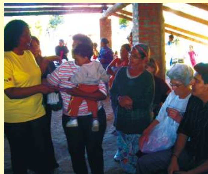
Encontro entre comunidades diferentes, Museu 13 de Maio e Associação Quilombola de Santo Inácio (Santa Maria - RS)