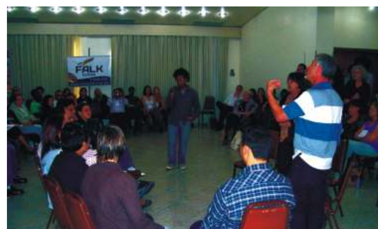
Grupo de Trabalho dinamiza oficina